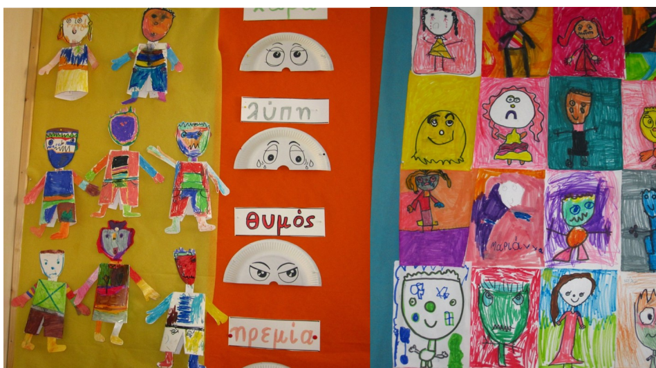
Απεικονίσεις συναισθημάτων από τις μικρές τάξεις

Το Erasmus+ πρόγραμμα ESTHER «Διδάσκοντας για Συναισθήματα στην Ευρώπη» εντάσσεται στη Δράση ΚΑ2 / Στρατηγικές Συμπράξεις μεταξύ σχολείων. Χρηματοδοτείται από την ΕΕ μέσω του ΙΚΥ και έχει διάρκεια 2 σχολικά έτη (2014-2016).