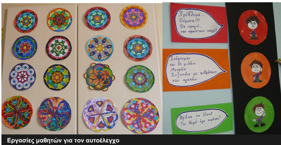
Εργασίες μαθητών για τον αυτοέλεγχο

Χρησιμοποιήσαμε την τεχνική χρωματισμού μάνταλα για να διοχετεύσουν οι μαθητές την ενέργειά τους καθώς και το φανάρι του θυμού για να εξασκηθούν στον έλεγχο του θυμού και της επιθετικότητας. Το φανάρι του θυμού χρησιμοποιήθηκε πολλές φορές σε περιπτώσεις συγκρούσεων μεταξύ των μαθητών.