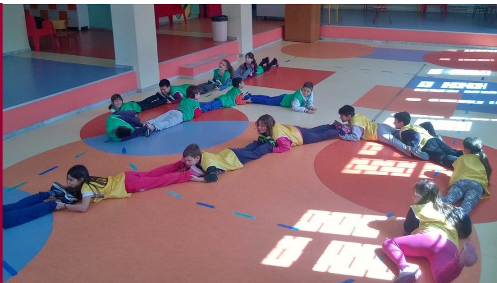
«Το γιγάντιο φίδι»

Οι μεγάλες τάξεις συνέλεξαν ειδήσεις που γεννούσαν συναισθήματα και έγραψαν παραμύθια που περιείχαν έντονα συναισθήματα, ενώ οι μικρές τάξεις τραγούδησαν για τη χαρά. Το ραδιοφωνικό πρόγραμμα περιλάμβανε και δελτίο καιρού συναισθημάτων!