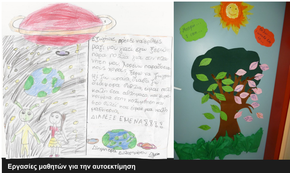
Εργασίες μαθητών για την αυτοεκτίμηση